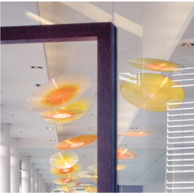
SIDE Tagungsbereich 8. Etage