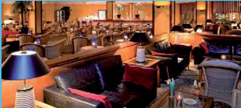
Piano-bar Bar « El Belingo »