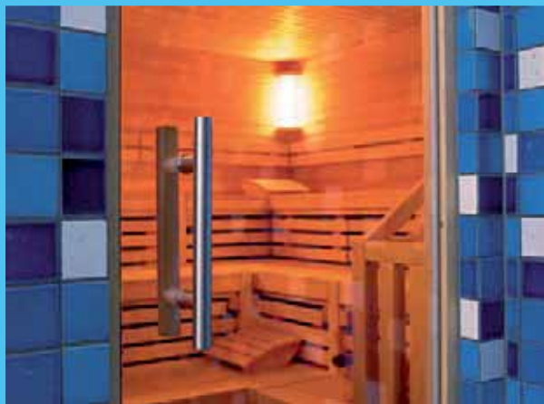
SPA & Wellness