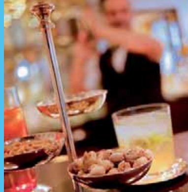
Piano bar Bar nocturno "El Belingo"